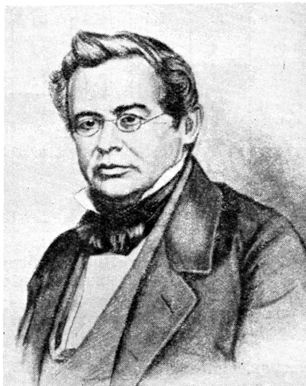
Эмилий Христианович Ленц (1804–1865)

ров лабораторной техники физического кабинета Дерптского университета в экспериментальных исследованиях, в том числе и в области электромагнетизма.