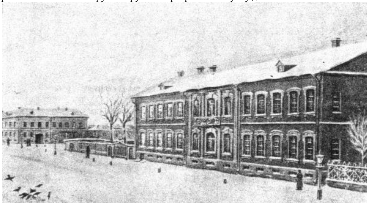
Дом, где жил Л. Эйлер в 1766-1783 гг. (реконструкция)

Наконец после долгого отсутствия Эйлер снова увидел Петербург в июне 1766 года. Белые ночи напомнили ему его молодость, которая прошла, как и вся его жизнь, за письменным столом – но все же это была молодость, всегда сопровождаемая трепетом жизни, сознанием сил. На другой день своего приезда Эйлер с двумя старшими сыновьями представлялся императрице. Императрица милостиво обошлась с ним и обещала ему добиться от Фридриха позволения младшему Эйлеру оставить Пруссию. В то же время Екатерина пожаловала Эйлеру 8000 рублей серебром на покупку дома.