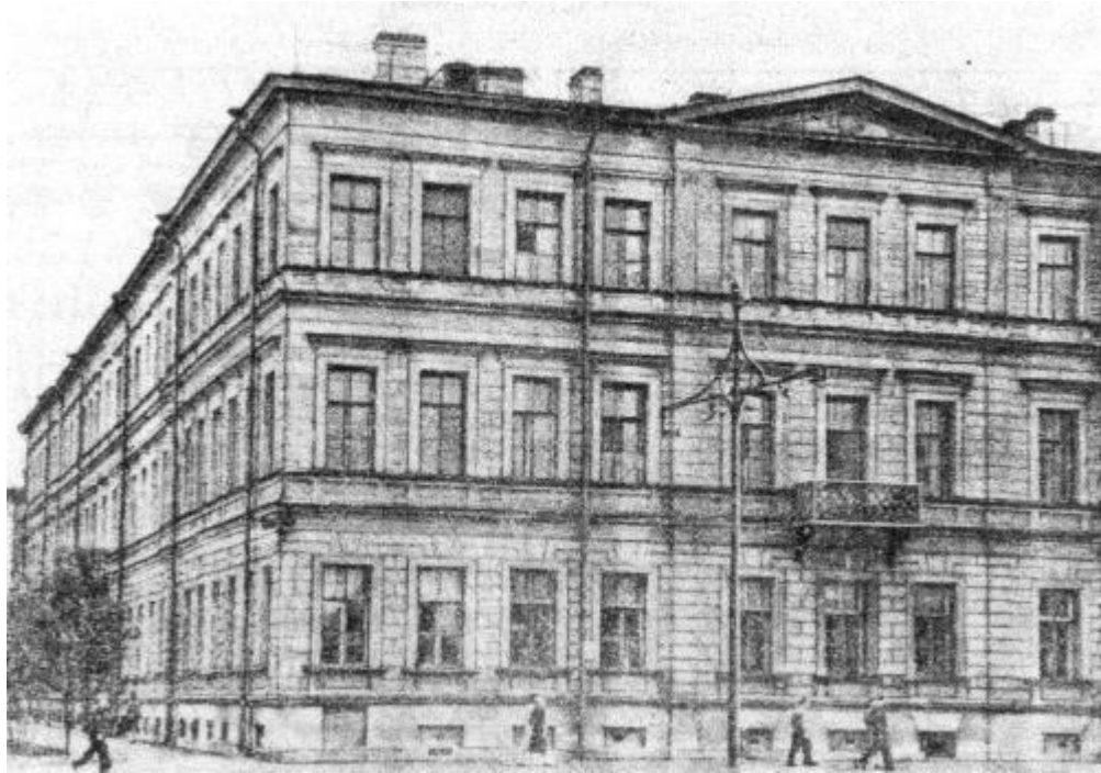
Дом Л. Эйлера. Набережная Лейтенанта Шмидта, д.5. Фотография, 1956

Для слепого старца эти неприятности были сушим несчастьем. В свой прежний дом он переселился слепым и с большим трудом изучил его ощупью, наконец он начал ходить по нему свободно, знал, где что лежит и стоит, а теперь приходилось начинать все снова. Тяжело тратить на это время, когда сознаешь, что можешь употребить его на пользу любимой науки. К счастью для последней, все это не выводило Эйлера из себя. Нетерпение и досада еще более увеличили бы трату времени.