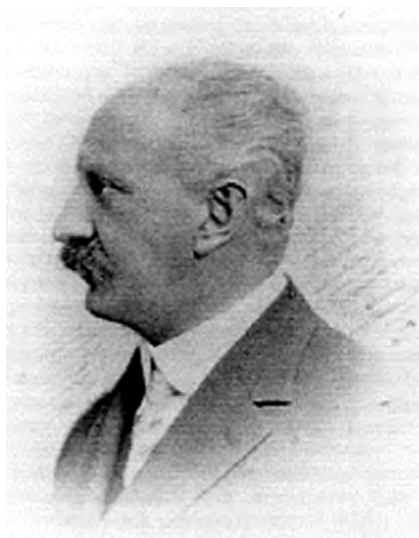
Рис. 2. А.Ф. Иоффе

Остро стояли задачи усиления связи науки с промышленным производством и эффективности прикладных исследований в стране. По инициативе А.Ф. Иоффе в 1925 году создается Ленинградская физико-техническая лаборатория (ЛФТИ) для исследований прикладной направленности, тесно взаимодействовавшая с промышленностью. Она подчинялась непосред-