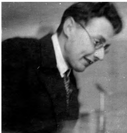
Рис. 5. Борис Васильевич Курчатов.

От исследования изоляции и диэлектриков Игорь Васильевич переходит к новой теме – сегнетоэлектричеству. У него уже достаточно большая группа исследователей, затем Лаборатория. За несколько лет выполнен обширный цикл исследований. Итоги его Курчатов подводит в книге «Сегнетоэлектрики», выпущенной в 1933 году, первой в мире монографии по сегнетоэлектричеству. Именно пионерские исследования сегнетоэлектриков сделали И.И. Курчатову имя в