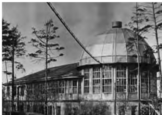
Рис. 9. Здание циклотрона в начале 1941 года.

Затем последовал проект циклотрона ЛФТИ, который должен был стать крупнейшим в Европе на то время. Работы начались в 1936 г. Проектированием и строительством руководили И.В. Курчатов и А.И. Алиханов. О важности этих работ свидетельствует тот факт, что трехтомник «Атомный проект СССР», изданный в 1998 году [5], открывается документом № 1, датированным 5 марта 1938 года, связанным с ходатайством о выделении 1 млн. рублей для строительства этого циклотрона, как экспериментальной базы ядерных исследований. Этот документ представ-