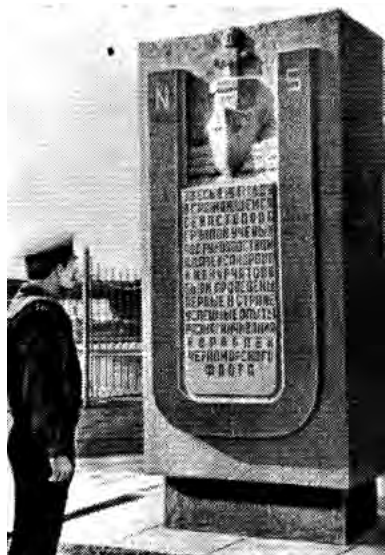
Рис. 13. Памятник в г. Севастополе размагничивание кораблей.

руководством А.П. Александрова и И.В. Курчатова (Рис. 13). Памятник был построен на деньги военных моряков. Он прост и выразителен: постоянный магнит в виде буквы «U», между полюсами – корабль, к которому из полюсов подходят волны – силовые линии 11 .