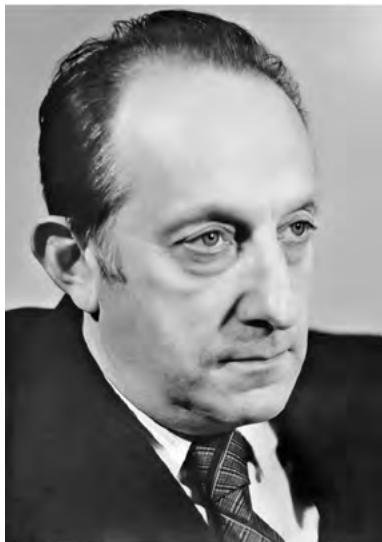
Рис. 16. Академик В.Е. Голант.

В настоящее время половина из систем диагностики, поставляемых Россией для международного проекта термоядерного реактора ИТЕР, выполняется в ФТИ. Физтеховский сферический токамак «Глобус-М» входит в тройку лучших сферических токамаков мира наряду с NSTX (Лаборатория физики плазмы, Принстон, США) и MAST (Калемский научный центр, Абингтон, Великобритания) (Рис. 17).