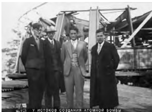
Рис. 8. И.В. Курчатов с сотрудниками на строительстве циклотрона ЛФТИ в 1940 году.