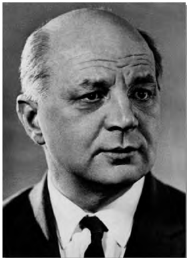
Рис. 15. Академик Б.П. Константинов.

изотопов урана. Всего в это время в Атомном проекте было задействовано порядка двух сотен работников ЛФТИ, включая практически всех ведущих ученых [12].