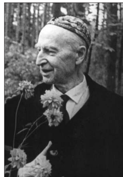
Алексей Васильевич в лесу на даче. 1969 г.

Сейчас много говорят и спорят о том, кого можно причислить к русской интеллигенции (да и сохранилась ли она?). Алексей Васильевич Шубников, выросший в простой и бедной семье, для всех знавших его был образцом русского интеллигента. Его огромный талант сочетался со скромностью, сдержанностью и мягкостью, не шедшими ни на какие компромиссы с совестью. Требовательный к себе, доброжелательный к дру-